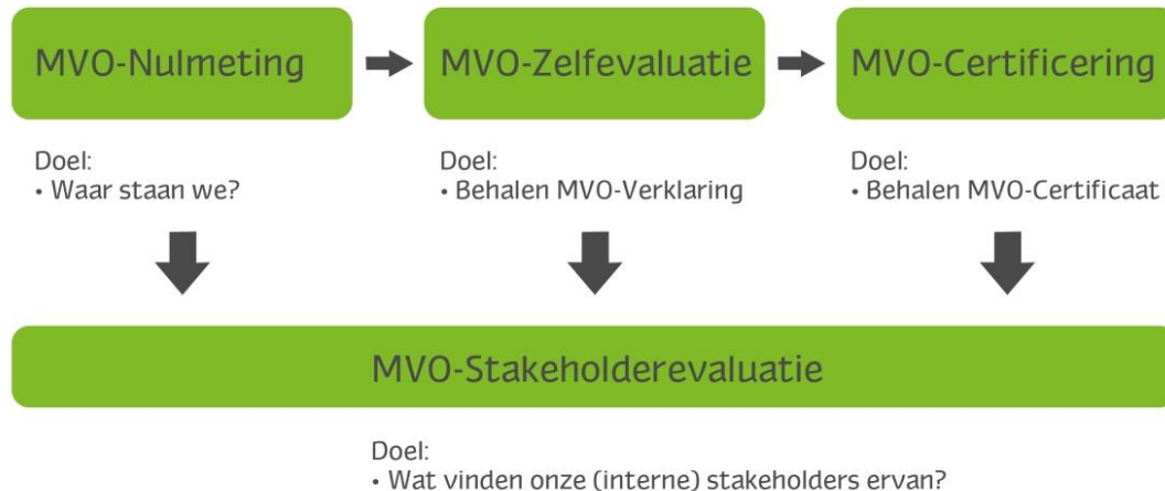
Figuur 1: Producten van De MVO-Wijzer

Op de volgende pagina's vindt u de uitgebreide instructie.